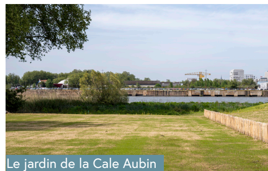
Le jardin de la Cale Aubin