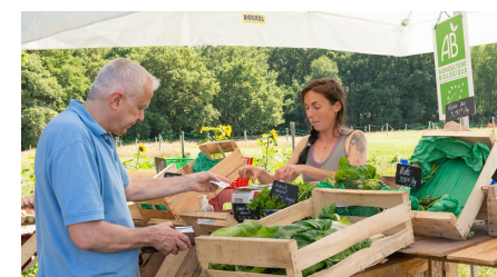
Vente directe des produits de la ferme du Bois des Anses