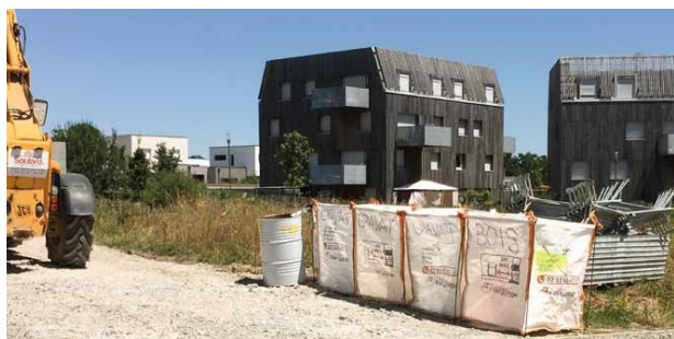
Tri des déchets de chantier au Vallon des Garettes