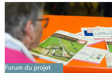
Forum du projet