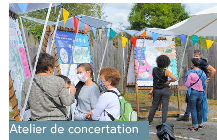
Atelier de concertation