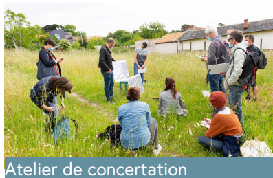
Atelier de concertation

Le projet se construit avec les habitants et usagers du quartier. Une première phase de dialogue (2018-2019) avec les habitants du Bois Hardy avait fait émerger des envies pour le quartier, mais aussi des craintes sur son futur aménagement. Pour prendre en compte plus fortement les enjeux de transition (sociale, écologique, économique), la Collectivité a mis en place une seconde démarche de concertation. Un atelier citoyen s'est réuni à plusieurs reprises entre 2021 et 2022 autour d'une mission : répondre aux questions posées dans le mandat citoyen remis par la Collectivité sur les enjeux à prendre en compte dans l'aménagement du quartier.