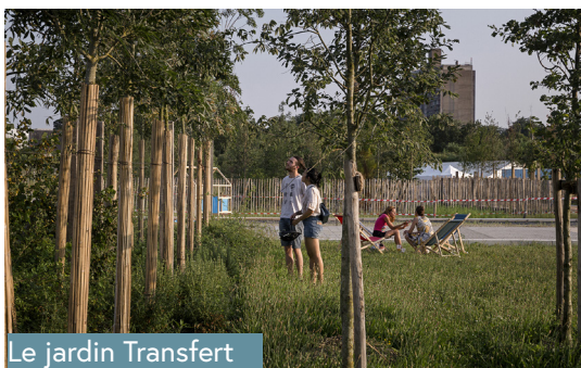
Le jardin Transfert

Entre septembre 2021 et février 2022, Nantes Métropole, avec les Villes de Rezé et de Nantes, a organisé une concertation avec des citoyens, des habitants et des actifs du territoire. Objectif : imaginer le mode d'emploi du quartier et les futurs usages du quotidien. Plusieurs ateliers ont permis aux participants de concevoir des solutions à la fois originales et concrètes pour répondre aux enjeux de mobilité, de travail, d'alimentation, et de vie collective dans un contexte de nécessaire transition environnementale.